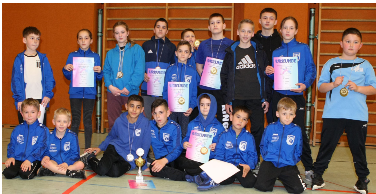
Die TSV-Mannschaft, die den 2. Platz in der Vereinswertung errang (2 fehlen)

Der TSV Kottern aus Kempten holte sich mit 44 Pkt den 3. Pokalplatz, gefolgt vom KSV Aalen 05 (40 Pkt), dem SV Ebersbach (39 Pkt) und dem SVH Königsbronn (32 Pkt). Auf den ersten 3 Plätzen der Gesamtstatistik sind sich die Leader KSV Unterechingen (1266 Pkt), die TSV Herbrechtingen (1209 Pkt) und der TSV Westendorf (1189 Pkt) aktuell nun auf die Pelle gerückt.